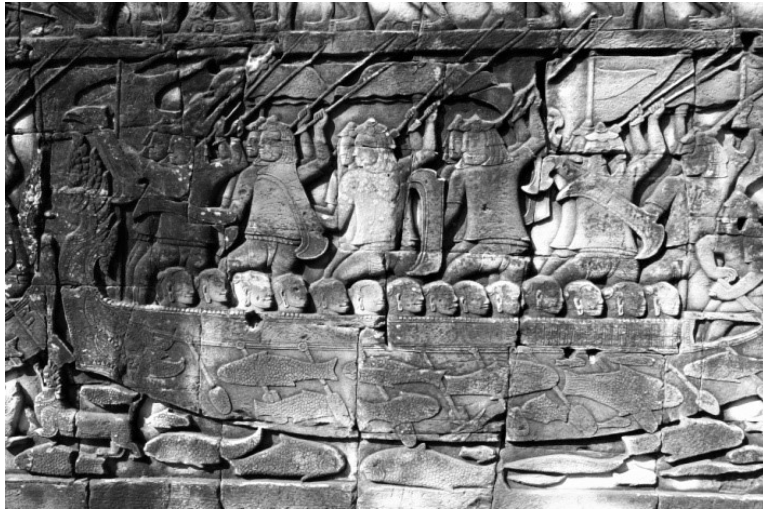
Afbeelding 3: Een reliëf in de Bayon in Angkor over de oorlogen in Angkor toont een scène die ook tot de geschiedenis van Vietnam behoort: een boot met Chamstrijders (helm met omgekeerde lotusbloem) en Khmersoldaten (blootshoofds). Blijkbaar vochten Cham en Khmer samen tegen anderen.

namezen tegen China, de vasthoudendheid waarmee zij zich tegen de bedreigingen van buitenaf verzetten en de mate waarin zij steeds gericht waren op nationale eenheid en onafhankelijkheid. Wie 'die Vietnamezen' waren vroegen de Vietnamese of westerse auteurs zich daarbij nauwelijks af.