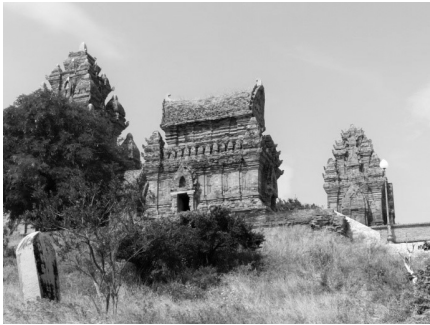
Afbeelding 2: Het tempelcomplex van de in de geschiedschrijving van Vietnam dikwijls 'vergeten' Cham in Po Klong Garai.

kregen een belangrijke plaats in de verhalen van de Vietnamezen en hun verbeelding van de oorlog. Hierin was niet alleen zichtbaar dat de overlevenden of nakomelingen hen voortdurend om zich heen ervoeren en hen uit hun benarde positie wilden bevrijden, maar ook dat de zielen van de overleden familieleden allerlei eisen stelden aan de levenden. Contacten met de dolende zielen waren van een heel andere aard dan die met de voorouders, maar zij vonden in de perceptie van de Vietnamezen wel plaats.