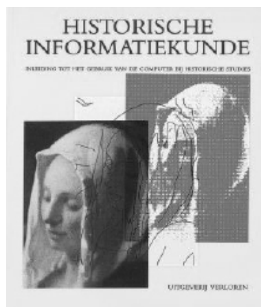
Afbeelding 1. Historische Informatiekunde . https://verloren.nl/boeken/2086/268/580/handleidingen/historische-informatiekunde . Geraadpleegd 13 februari 2017.

Wat waren de onderwerpen waar historisch informatiekundigen zich rond die tijd druk over maakten? Ik noem er hieronder een paar waarvan de oplossing mede door Nijmeegs onderzoek naderbij werd gebracht.