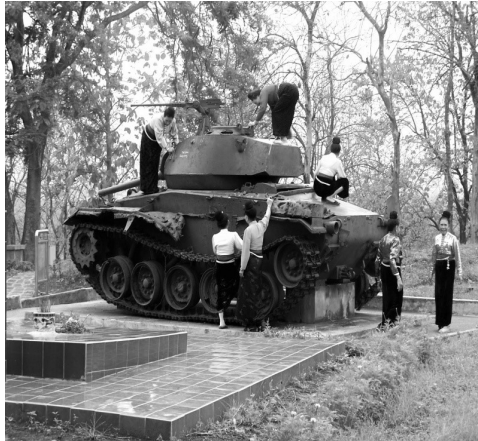
Afbeelding 1: Vrouwen van de Taybevolking uit de buurt van Dien Bien Phu klimmen in hun 'zondagse' kleren op een Franse tank op steunpunt Eliane 2 in Dien Bien Phu.

Een veelgehoorde opvatting is dat de oorlogen die tussen 1945 en 1975 in Vietnam woedden en die alleen al tussen 1963 en 1975 drie miljoen Vietnamezen het leven kostten grotendeels uit de herinnering van de Vietnamezen zijn verdwenen. Vaak verwijst men dan naar het grote aantal jongeren dat later is geboren. In materieel opzicht – men denke aan het herstel van de bruggen, een groot deel van het landschap, de steden en de dorpen en natuurlijk ook aan de snelle economische ontwikkeling van de laatste decennia – heeft Vietnam de oorlog ondertussen wel achter zich gelaten. Er zijn echter nog steeds grote effecten op het gebied van het milieu en de gezondheid. Bovendien vindt de mentale en geschiedkundige verwerking van de Vietnam Oorlog van de jaren zestig en zeventig (of De Amerikaanse Oorlog of De oorlog voor nationale redding tegen de Amerikanen, zoals de officiële aanduidingen van de Vietnamese communistische regering zijn) nog steeds volop plaats. De mentale verwerking blijkt uit de vele herdenkingstekens en grafvelden die naar de oorlog verwijzen met het